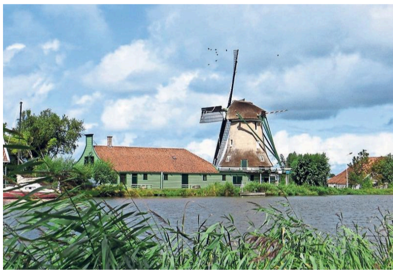
Molen De Paauw wordt 7 september officieel geopend.

Nieuwenhuijs en zijn ploeg moesten het wiel zelf uitvinden, want van dit uitgestorven molentype zijn geen exacte bouwtekeningen. De laatste Zaanse hennepklopper, De